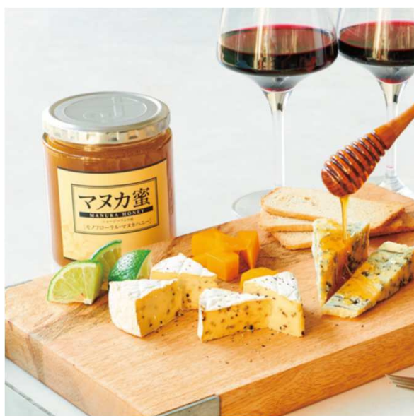
奶酪加麦卢卡蜂蜜