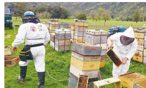
正在采蜜的杉养蜂园的养蜂部员