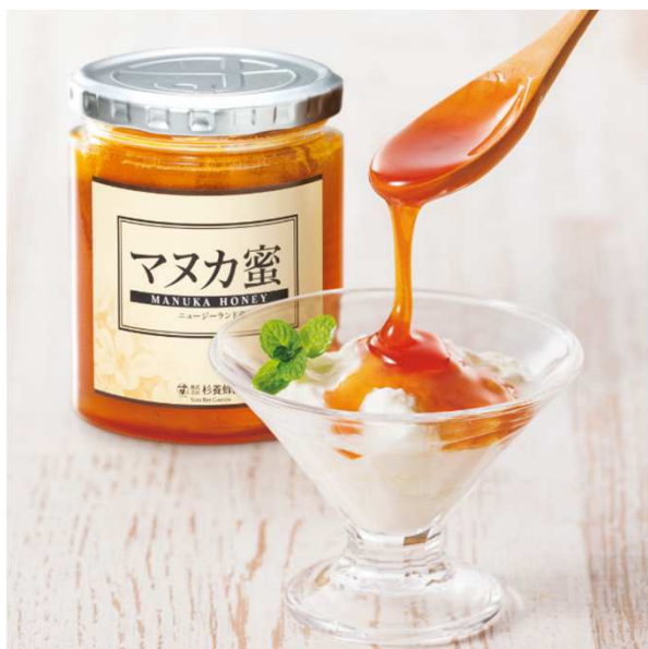
酸奶加麦卢卡蜂蜜