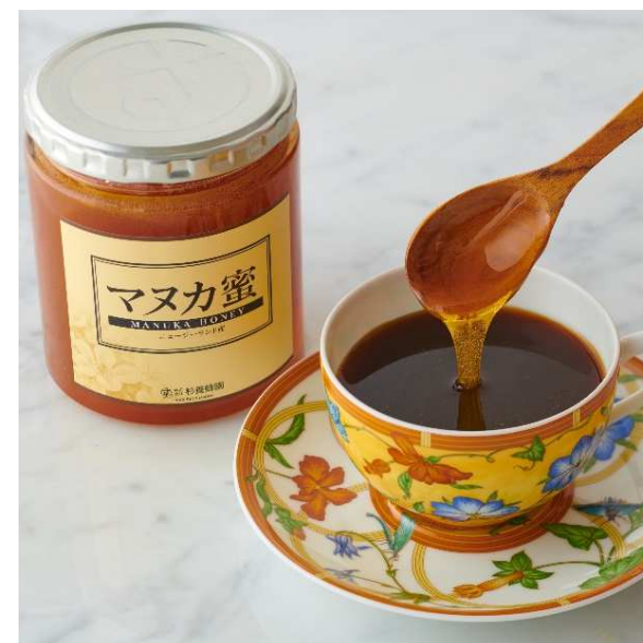
咖啡加麦卢卡蜂蜜