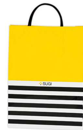
杉養蜂園原創禮品袋 蜜蜂手提袋

蜂蜜漬花梨、蜂蜜漬薑片、蜂蜜漬高麗人參 (各280g) 裝在專用盒子裡, 是很受歡迎的禮物套裝。 請作為祈願重要的人健康的禮物使用。 還可以配上杉養蜂園原創禮品袋。