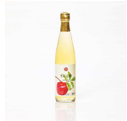
自家產品 蘋果醋 500ml