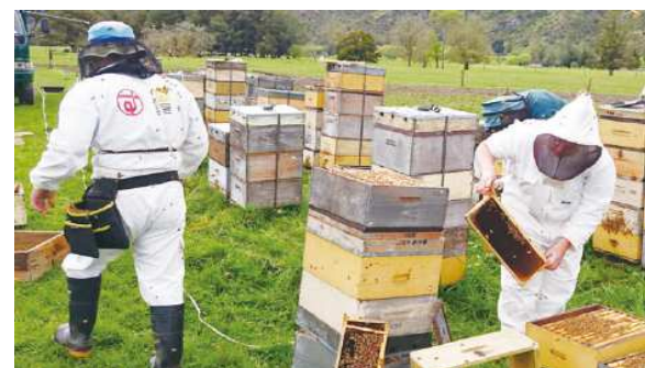
进行采蜜的杉树养蜂园