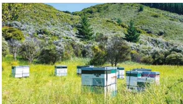
位于盛开着白色麦卢卡花的大自然中的养蜂场

新西兰政府制定了严格的标准，对新西兰产的麦卢卡蜂蜜进行质量管理。我们的养蜂业在新西兰也受到高度评价，与当地的养蜂人共同进行采蜜。