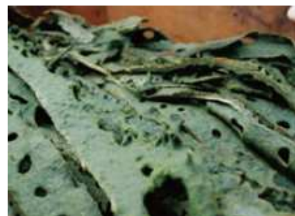
高品质的天然蜂胶